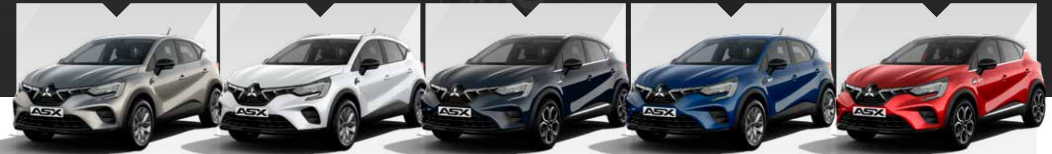
1.6 PHEV AT