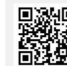
Goodyear 215/60 R17 96 H

* Brandstofverbruik en CO2-waarden variëren afhankelijk van het uitrustingsniveau. De verbruikscijfers zijn gemeten volgens de World Harmonised Light vehicle Test Procedure (WLTP) in overeenstemming met EU 715/2007*2018/1832. De resultaten van de testcyclus kunnen afwijken van het praktijkverbruik. Het praktijkverbruik is sterk afhankelijk van het rijgedrag, de rijomstandigheden, andere invloeden zoals weer, verkeer en de toestand van het voertuig.