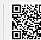
Bridgestone 215/60 R17 96 H

Scan de QR-code voor het nieuwe EU-energielabel voor banden.