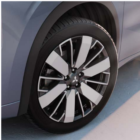
20-inch Diamond-Cut lichtmetalen velgen