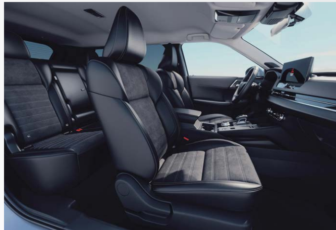
Luxe Comfort-tec synthetisch lederen bekleding